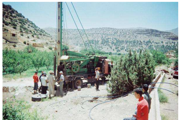
Le forage en juin-juillet 2010